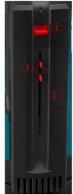
INTRARE APA COMPARTIMENT PLUTITOR

RECOMANDARE! Pentru ca răcirea motorului să se facă în condiții optime, folosiți modul AUTO sau modul MANUAL selectând un nivel al apei astfel încât corpul pompei să fie imersat cât mai mult în apă.